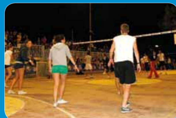
Torneo in notturna