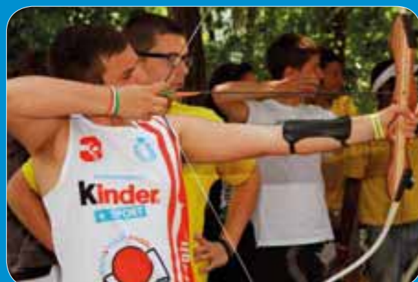
Tiro con l'arco