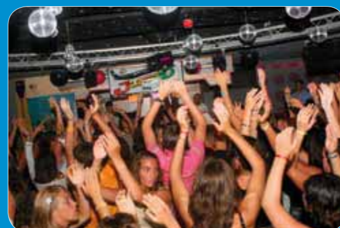
Festa di benvenuto