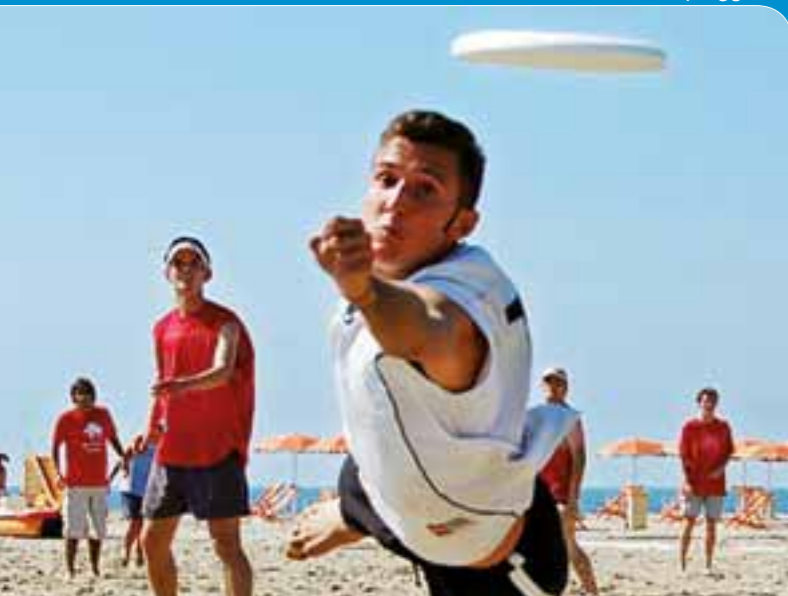
Frisbee in spiaggia